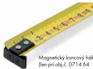
Magnetický koncový hák (len pri obj.č. 0714 64 569)

Vreckové meracie pásmo spĺňa triedu presnosti 2.